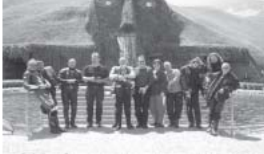
Swarovski - Riese

und ließen anschließend die Kristallwelten auf uns einwirken, bevor es zum Mittagstisch ging.